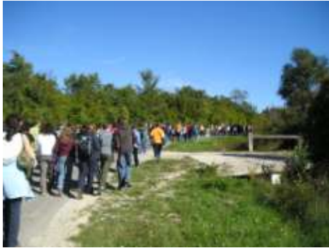
Dan pješaćenja stariji razredi obilježili su pješaćenjem u Ripendu. U početku je bilo lako...