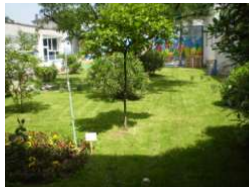
Zid u unutarnjem školskom vrtu oslikali su članovi likovne radionice.