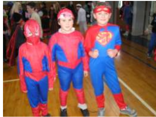
Ca nismo provi Spidermeni?