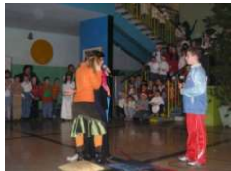
Kako je lijepo glumiti... Učenici mlađih razreda u igrokazu povodom božićnih blagdana...