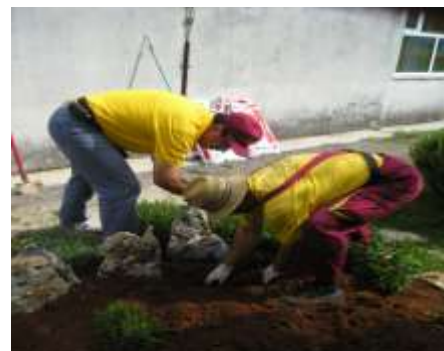
U našem eko vrtu...S ljubavlju sadi, ljepše će cvjetati! Rasadnik Dives donirao nam je sadnice da nam vrt bude još ljepši...