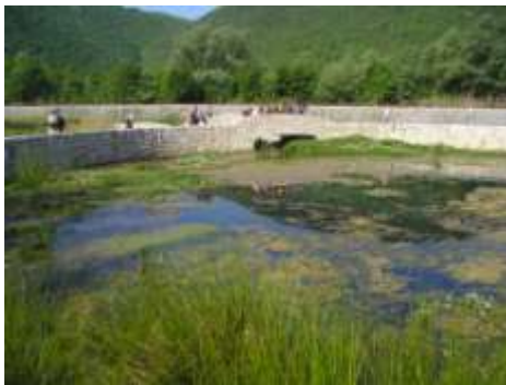
Bilo nam je zanimljivo i poučno...