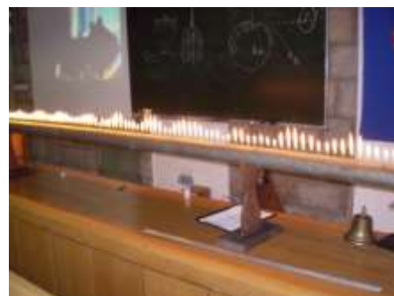
Učenici 7. i 8. razreda posjetili su Srednju školu Mate Blažine Labin i sudjelovali u pokusima koje su pripremili znanstvenici iz Zagreba...