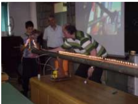
Ki je reka da sopela i mirakul od ognja ne moru skupa?