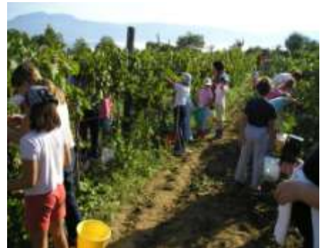
Slatko je uz čehulje grožđa... Učenici Područne škole Rabac u berbi grožđa.