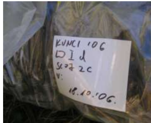
Sve je to ovjekovječio fotoaparatom nastavnik tehničke kulture.