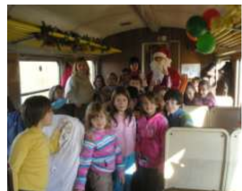
Uz djeda Božićnjaka i poklone vožnja vlakom od Pazina do Kanfanara bila je nezaboravna... ( Putovali su učenici mlađih razreda. )