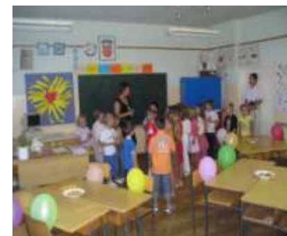
1.b razred s učiteljicom