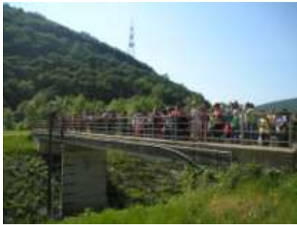
Voda je izvor života... Učenici mlađih razreda posjetili su izvor Mutvica.