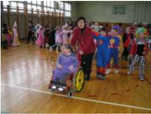
Maškare, ca moro maškare...