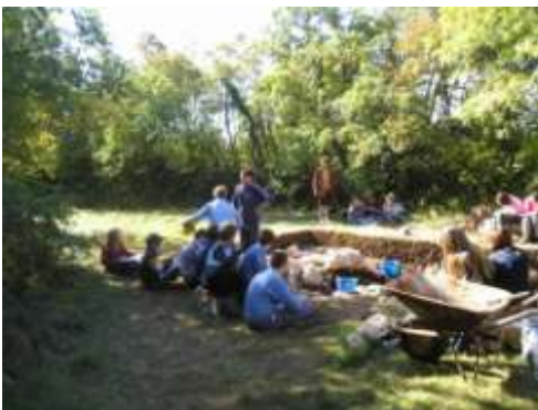
18.10. 2006. učenici šestih razreda u pratnji nastavnice iz povijesti, hrvatskog jezika i prirode posjetili su arheološko nalazište iskopina starih Ilira na lokaciji Monte Kunci u Ripendi.