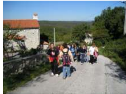
A na kraju ...