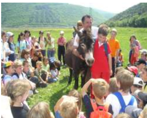
Brižan tovor. Ni njemu ni vajka lahko... Istom prigodom posjetili su Donišnicu – farmu magaraca