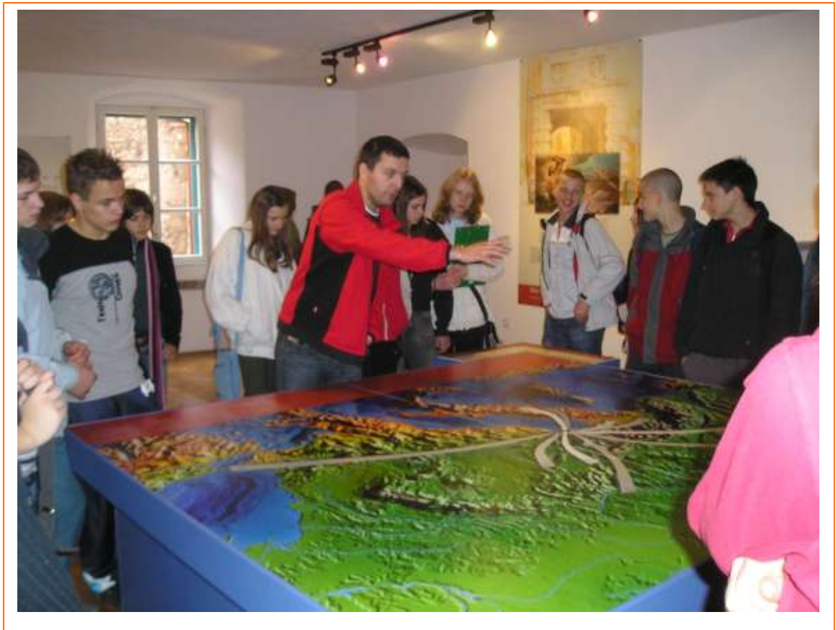
Susret učenika riječke i labinske škole

Nakon što su se neki od naših učenika upoznali s Riječanima, mi novinari i naša foto grupa uputili smo se s Riječanima i njihovim nastavnicima prema muzeju u starom gradu.