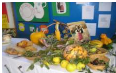
Ca so jali naši stori ...