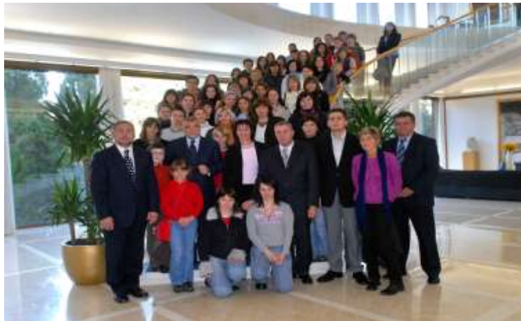
Predsjednik nas je primio u sklopu građanskog sata «S predsjednikom na kavu» (mi smo pili sok)...

Tijekom ove školske godine vijeće je posjetilo predsjednika Republike Hrvatske Stjepana Mesića.