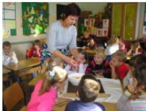
Smo mesili, kuhali i jali...