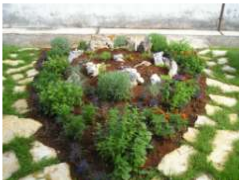
Kamenjar u unutarnjem školskom vrtu..