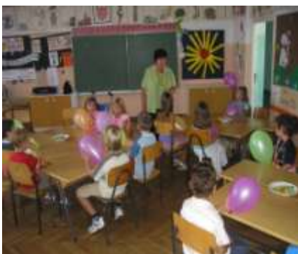
1.a razred s učiteljicom