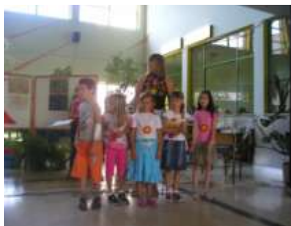
1. razred Područne škole Rabac s učiteljicom